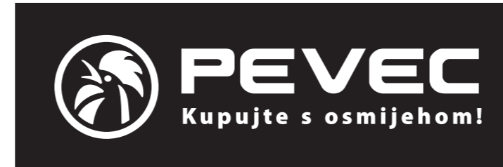
POZADINA 100 % crna